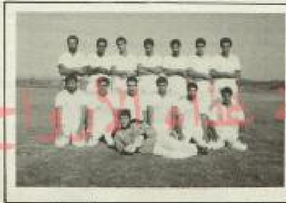
فرقت شباب المزمرة - من ابريقه اولى : اخلاقى ومن