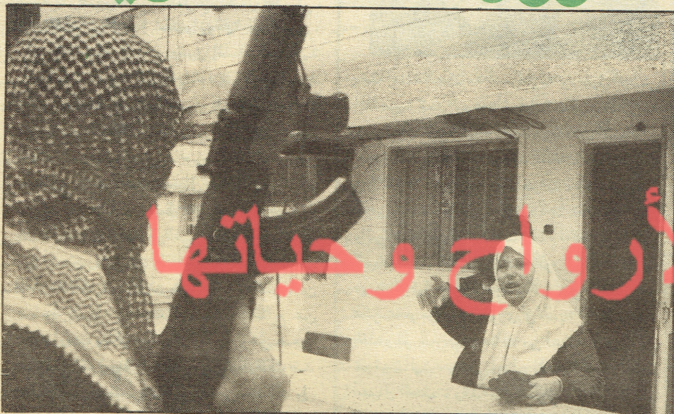
امرأة فلسطينية في الكويت تواجه مسلح لإطلاق سراح ابنها... ما أشبه هذه الصورة ببيروت

كانت في البنوك قبل الغزو رغم أن البلد في أمس الحاجة لها « ، ويدعو الحكومة الى عدم إعطائهم شيئاً ويقول « تلميذ شارون » هذا « وأعلم أن الذي سأكتبه وما سيكتبه غيري لم ولن والله يوفيهم حقهم وما يستحقون » ، ثم يعرج على الاردنيين في الاردن ويسرد من الاكاذيب ما تقشع له الابدان ، ثم يوجه نداءه الى أهل الكويت الى الحذر والتنبه من المقولة أن بعض الفلسطينيين ساعدوا الكويتيين أيام المحنة ووقفوا بجانبهم ويقول أن هؤلاء الفلسطينيون منافقون ولم يقفوا مع الكويتيين وإنما مع مصالحهم ، ثم تتفتق عبقرية العادل هذا الى الحل فيقول الحل بسيط « هم فلسطينيون لا جثون ... واللاجيء لا بلد له ، والعرف أن يكون اللاجئون في الخيام ... نعم في الخيام ولكن على الحدود ... وهناك الأمم المتحدة ترعاهم ... وهناك منظمة التحرير التي تملك الكثير من ( المصاري ) ترعاهم ... نعم إن الحل هو بطردهم الى المنطقة المنزوعة السلاح بيننا وبين حليفهم العراق ... ثم يؤكد نداءه للشعب الكويتي برفع صوته والوقوف جميعاً بيدا واحدة والامتناع عن الذهاب الى العمل حتى لو كان هناك موظف فلسطيني واحد معنا . . . إنتهى المقال الذي اقتطفنا منه أجزاء ، ونحن ندعو كاتب المقال « ظالم عبد الشيطان » للاجتماع بشارون لتنفيذ مخططه ، ونأسف كل الاسف لتلك الصحف التي تنشر مثل هذه المقالات وأشباهها .