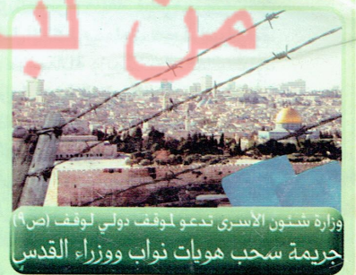
وزارة شؤون الأسرى تدعو لوقف دولي لوقف (ص ٩) جريمة سحب هويات نواب ووزراء القدس